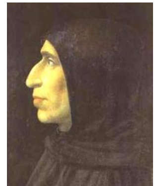
Girolamo SAVONAROLA (21. 9. 1452 – 23. 5. 1498)

Celý svet vie, že Jeho slávu nešírili silou a zbraňami, ale chudobnými rybármi.