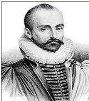
Michel MONTAIGNE (28. 2. 1533 – 13. 9. 1592)

Život zasvätený miernosti je lepší ako ten, ktorý pripúšťa výstrednosti... Život nie je ani dobro ani zlo; iba miesto pre dobro alebo zlo, podľa toho, čomu dáme prednosť... Skutočným zrkadlom našich úvah je priebeh našich životov... Človek by mal aspoň zmúdiť vlastnou škodou!... Najistejším znakom múdrosti je trvalá radosť... Pokladám za znesiteľnejšie byť stále sám, ako nebyť nikdy sám.