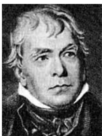
Walter SCOTT (15. 8. 1771 – 21. 9. 1832)

Nejlepší část vzdělání je ta, kterou člověk získal sám... Trochu stříbra zničilo víc duší než ostrý meč těl... Pravá láska je dar, který Boh daroval osamelému člověku dole na zemi.