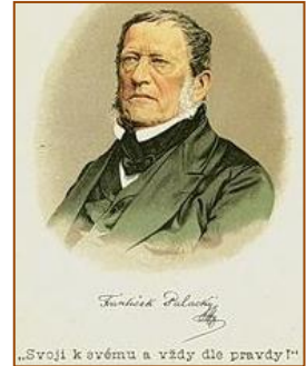
František PALACKÝ (14.6.1798 – 26.5.1876)

Cena človeka spočíva nie tak vo fyzickej a rozumovej sile a zručnosti, ako v mravnom správaní sa, v spravodlivosti a šľachetnosti; a ... keby kto aj celý svet na ruby obrátiť vedel, nemôže byť mužom veľkým, ak zostáva nulou čo do mravnosti.