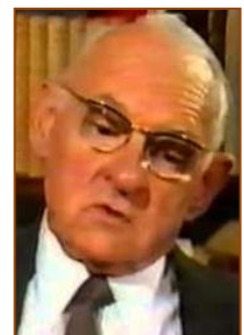
Hans URS von BALTHASAR (12.8.1905 – 26.6.1988)

Naše počítačné slovo sa nazýva krása. Krása je posledným slovom, ktoré si uvažujúci intelekt môže dovoliť vysloviť, pretože ona korunuje, sťa svätožiara nepochopiteľného jasu, dvojitú hviezdu pravdy a dobra a ich vzájomný nerozlučiteľný vzťah... Každý dotyk krásy ukazuje na večnosť.