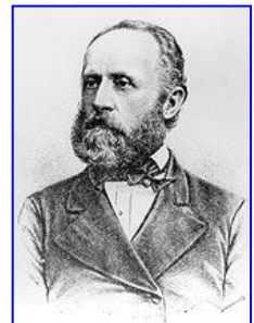
Pavol DOBŠINSKY (16.3.1828–22.10.1885)

Jestli som v čom neúplný, tým všestrannejší som v líčení zvyku a mravu ľudu nášho; by ďalší sberatelia, tým lepšie vyznali sa, nač pozornosť obrátiť, v čom dopĺňovať celok a prehľad týchto vecí, neodbytných k poznaniu ľudu vlastného a k dvíhaniu jeho na ďalší stupeň zvykov a mravov prečistenejších, ušlechtlejších.