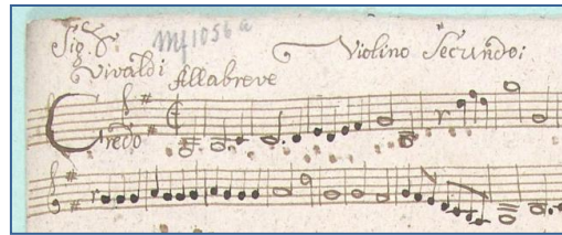
Antonio Lucio VIVALDI (4.3.1678–28.7.1741)

Jestli som v čom neúplný, tým všestrannejší som v líčení zvyku a mravu ľudu nášho; by ďalší sberatelia, tým lepšie vyznali sa, nač pozornosť obrátiť, v čom dopĺňovať celok a prehľad týchto vecí, neodbytných k poznaniu ľudu vlastného a k dvíhaniu jeho na ďalší stupeň zvykov a mravov prečistenejších, ušlechtlejších.