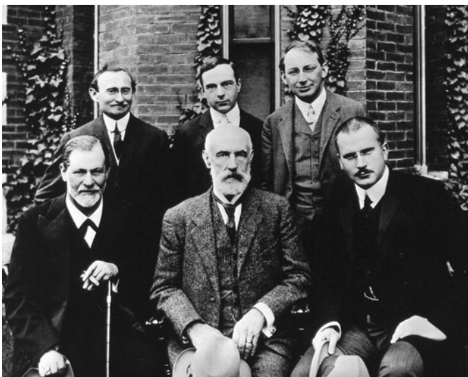
Skupinová fotografia z roku 1909 pred Clarkovou univerzitou. Vpredu zľava: Sigmund Freud, G. Stanley Hall, Carl G. Jung. Vzadu zľava: Abraham Brill, Ernest Jones, Sándor Ferenczi.

Jung rád uvádzal krásnu starú legendu o rabínovi, ku ktorému prišiel žiak a spýtal sa: Vôľakedy existovali ľudia, ktorí videli boha tvárou v tvár; prečo už dnes nie sú? Tu mu rabín odpovedal: Pretože sa dnes už nedokáže nikto skloniť tak hlboko. Človek sa však musí aspoň trochu skloniť, aby čerpal z prameňa. Možno vtedy duchovným zrakom zazrieme boha ako systém života s absolútnou vôľou a vedomím, ako harmonickú osobnosť ducha, ako všetko objímajúci princíp každej reality. Toho, ktorý je spojenie protikladov v láske.