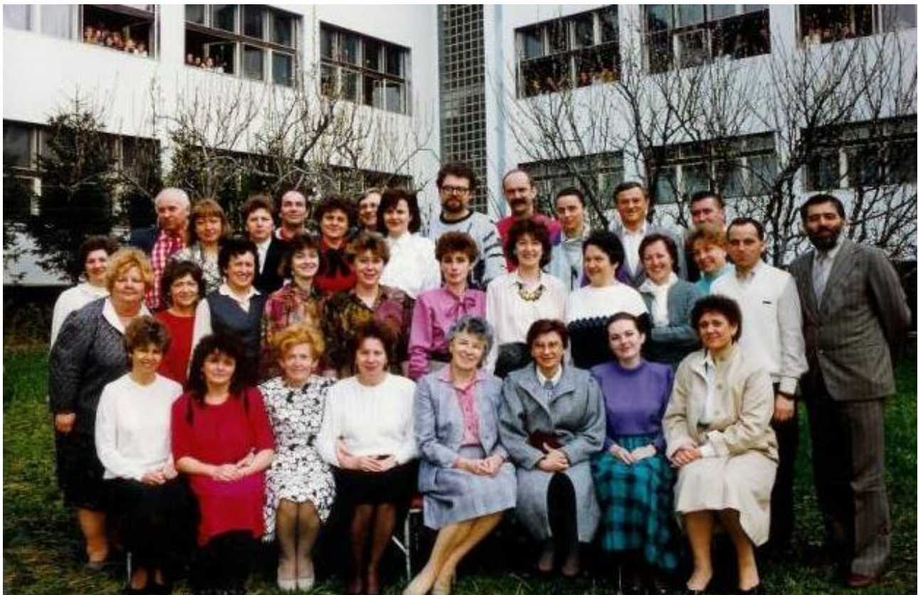
Profesorský zbor Gymnázia v Topoľčanoch 1990-1991

Existencia ľudstva je možná na základe prevaž- ných, hierarchických hodnôt, vo vzájomnom rozpäte a solidarite slobodných bytostí. Už v škole môže- me hodnotovať ľudskú slobodu na základe vždy ek- stremných hodnôt. Škola musí pripravovať umenie pásmo, silu a činnosť, odhodlaním k životu podľa pravdy a v úcty. Už v školách treba viac k tomu, aby sa naplnenie, nakrášľuje a najmä vyžaduje spoločne na pokre, aby sme opson najbližšie oku- li, pripravovali duchom i pozostovým myslením.