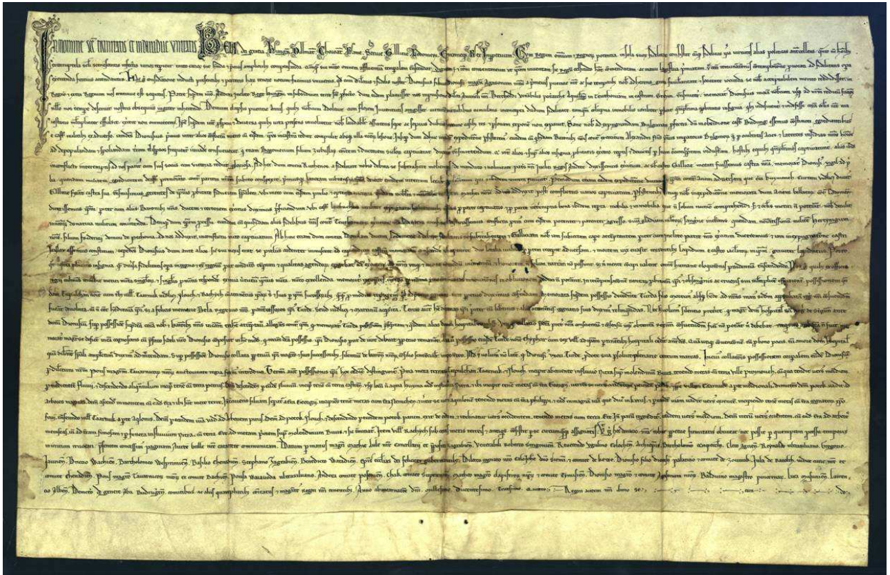
(kompletná kópia spomínanej listiny z roku 1235)

Anno ab incarnatione dñi. millesimo. ducentesimo. tricesimo. Quarto: